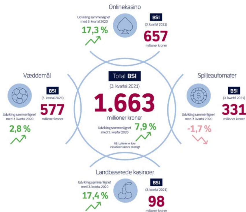
Figur 1. BSI for spilmarkedet i 3. kvartal 2021 og procentvis ændring fra 3. kvartal 2020

Tal fra Spillemyndighedens kvartalsstatistik viser, at den samlede bruttospileindtægt (BSI) for væddemål, onlinekasino, spilleautomater og landbaseret kasino i 3. kvartal 2021 udgjorde 1.663 mio. kr. Det er en stigning på 122 mio. kr. sammenlignet med 3. kvartal 2020, hvilket svarer til 7,9 pct. Kun spilleautomatområdet har ikke oplevet en stigning i 3. kvartal.