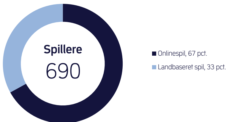
Figur 3. Fordeling af spillernes problemspil

Spillemyndigheden spørger også ind til hvilke spil, der er spillerens primære og sekundære problemspil. I alt var der 690 spillere og pårørende, der angav denne information. Tallene viser, at 67 pct. har onlinespil som deres primære eller sekundære problemspil. De resterende 33 pct. angiver landbaseret spil, fx fysiske spilleautomater, væddemål i kiosker og fysiske kasinoer, jf. figur 3.