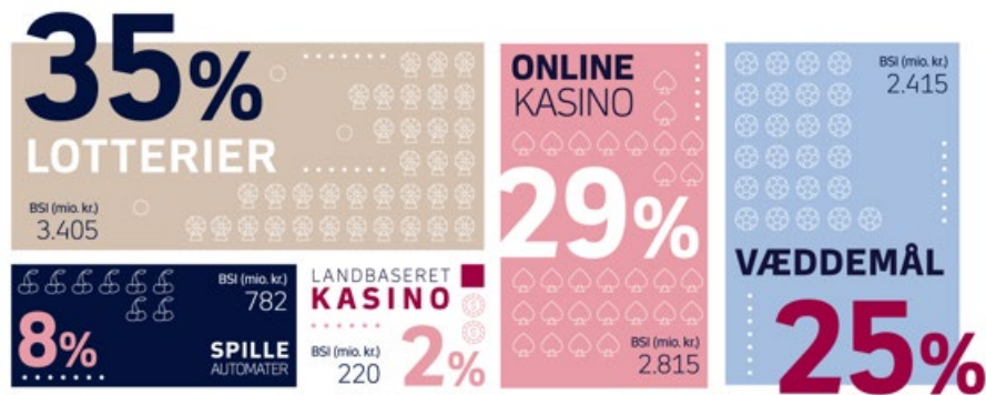
Figur 2. BSI og markedsandele for spilområderne i 2021

I 2021 var den samlede BSI for det danske spilmarked 9,6 mia. kr. Det største spilområde var lotterier med en BSI på 3,4 mia. kr., svarende til godt en tredjedel af det samlede spilmarked, jf. figur 2. Det mindste spilområde var de landbaserede kasinoer, som med 220 mio. kr. i BSI udgjorde 2 pct. af det samlede spilmarked i Danmark.