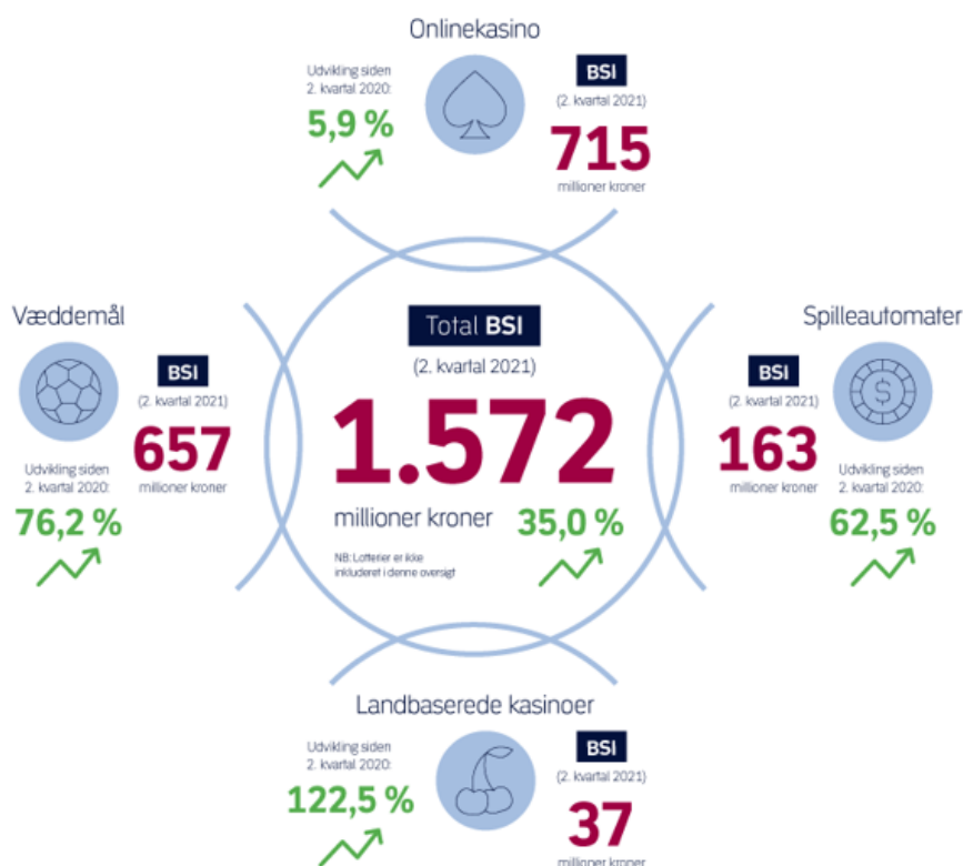
Figur 1. BSI for spilmarkedet i 2. kvartal 2021 og procentvis ændring fra 2. kvartal 2020

Spillemyndighedens kvartalsstatistik viser, at den samlede bruttospilleindtægt (BSI) for væddemål, onlinekasino, spilleautomater og landbaseret kasino i 2. kvartal 2021 udgjorde 1.572 mio. kr., jf. figur 1. Det er en stigning på 407 mio. kr. fra 2. kvartal 2020, svarende til 35 pct.