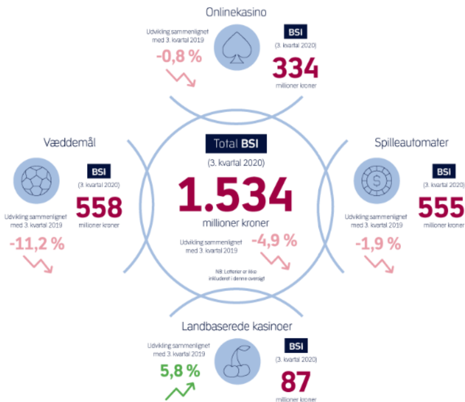
Figur 1. BSI for spilmarkedet i 3. kvartal 2020 og procentvis udvikling fra 3. kvartal 2019

Spillemyndighedens nyeste offentliggjorte kvartalsstatistik viser, at bruttospilleindtægten (BSI) for væddemål, onlinekasino, spilleautomater og landbaserede kasinoer i 3. kvartal 2020 faldt med 4,9 pct. sammenlignet med 3. kvartal 2019, jf. figur 1. Kun de landbaserede kasinoer så en stigning sammenlignet med 3. kvartal 2019. Derimod oplevede både væddemål, onlinekasino og spilleautomater tilbagegang.