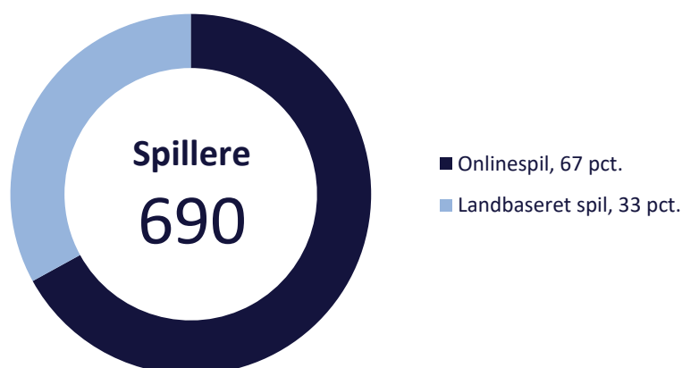
Figur 3. Fordeling af spillernes problemspil

Spillemyndigheden spørger også ind til hvilke spil, der er spillerens primære og sekundære problemspil. I alt var der 690 spillere og pårørende, der angav denne information. Tallene viser, at 67 pct. har onlinespil som deres primære eller sekundære problemspil. De resterende 33 pct. angiver landbaseret spil, fx fysiske spilleautomater, væddemål i kiosker og fysiske kasinoer, jf. figur 3 .