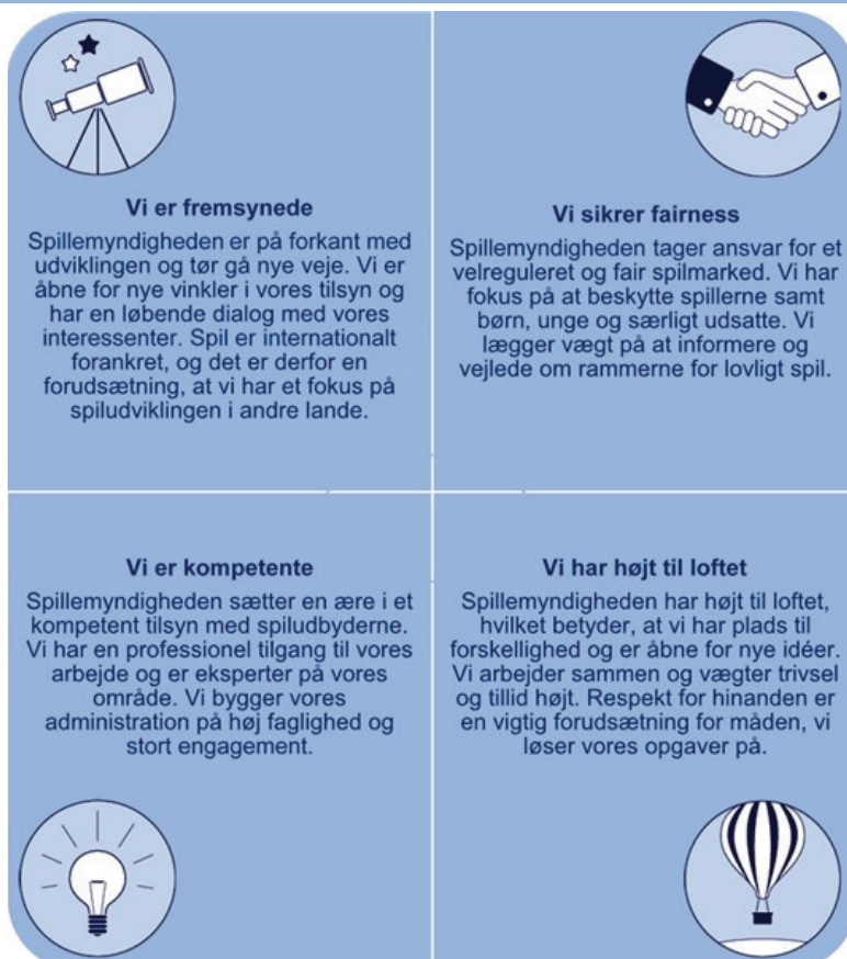
Figur 1. Spillemyndighedens fire værdier

Spillemyndigheden arbejder for et ansvarligt, fair og velreguleret spilmarked til gavn for spillere, spiludbydere og for samfundet. Åbenhed og dialog er kendetegnet for vores måde at arbejde på. Udviklingen og nye trends inden for spilverdenen stiller krav til vores ekspertise, og de mange spændende og udfordrende arbejdsområder går hånd i hånd med vores høje faglighed. Arbejdsglæde, nysgerrighed og engagement skaber de gode resultater. Spillemyndigheden har følgende fire værdier: